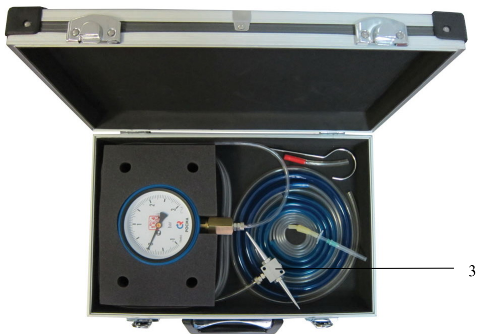
Рис.2 (вид сверху)