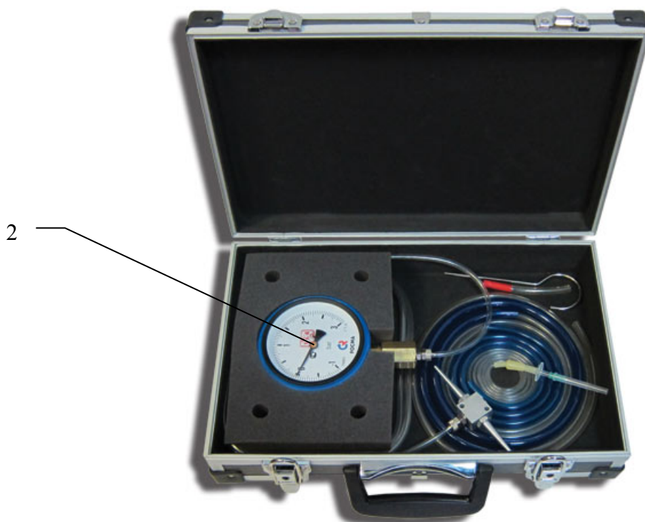
Рис.1 (вид спереди)

Приспособление (далее Приспособление) для проверки давления наддува турбированных двигателей представляет собой соединённый с мановакуумметром посредством силиконовой трубки тройник для подсоединения в систему впуска. В отличие от аналогичных изделий, в целях повышения универсальности применения, тройник Приспособления имеет конусообразные штуцеры для соединения с входящими в комплектацию трубками различных диаметров, включая дополнительную с иглой. Мановакуумметр имеет съёмный подвесной крюк для удобного крепления в салоне автомобиля, резиновый защитный чехол, в наличии также удобный кейс для хранения.